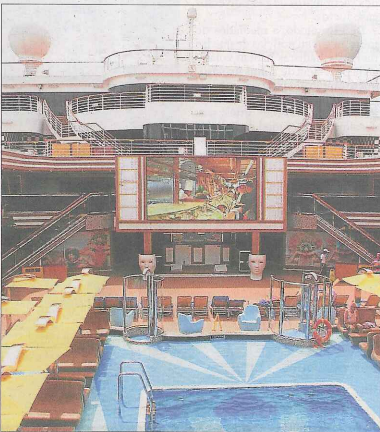
el buque más grande de la flota (abajo) JOF

nuevos barcos hasta convertirse durante algunos años en la líder absoluta del mercado.